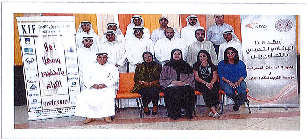
3- المشاركون ببرنامج (ادارة المخاطر)