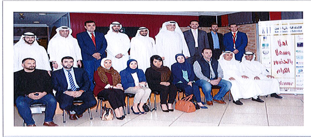
5- المشاركون ببرنامج (مهارات التسويق)