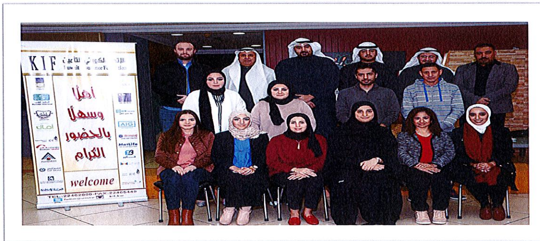
6- المشاركون ببرنامج (مبادئ الإكتتاب)