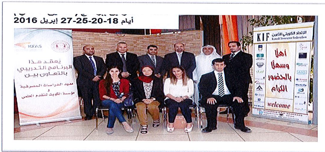
2- المشاركون ببرنامج (التدقيق الداخلي)