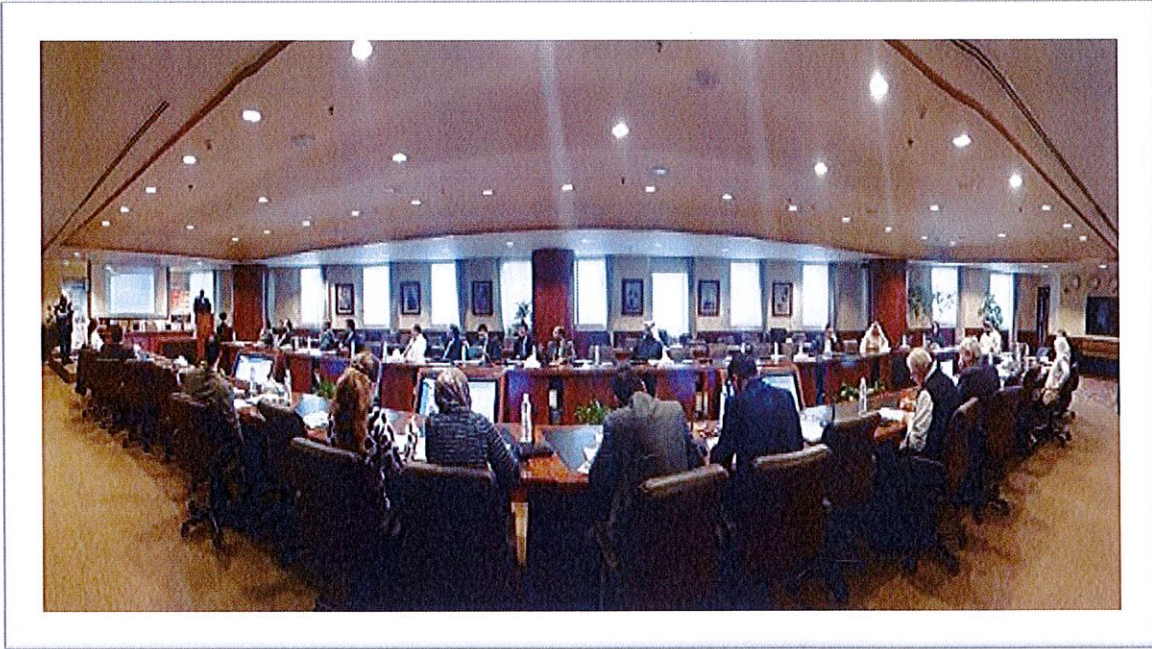
2- ورشة عمل (المسئولية المدنية العشرية) - 30 نوفمبر 2016