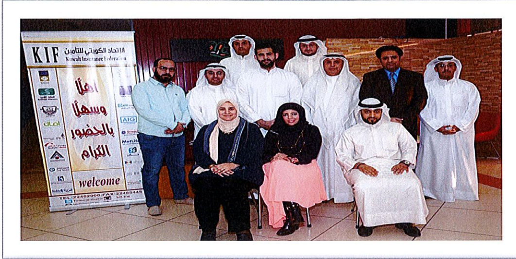
4- المشاركون ببرنامج (اعادة التأمين)