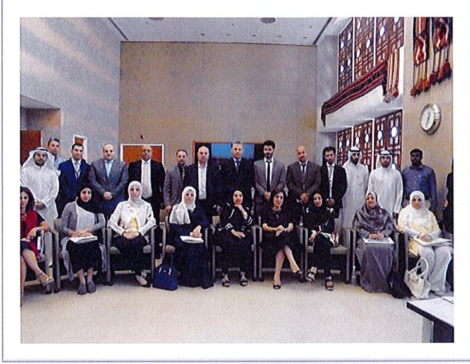
1- ورشة عمل (ادارة التأمين الصحي) - 5 أكتوبر 2016