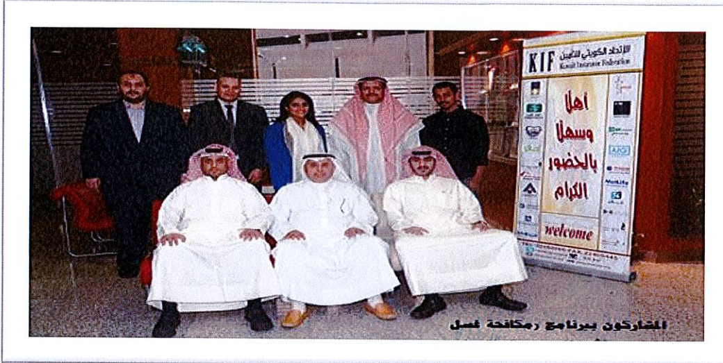
1- المشاركون ببرنامج (غسل الأموال وتمويل الارهاب)