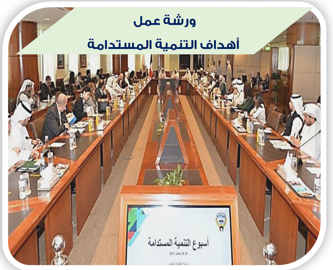
ورشة عمل أهداف التنمية المستدامة

المشاركة في ورشة العمل بغرفة صناعة وتجارة الكويت بتاريخ 2022/11/24 بعنوان ( اهداف التنمية المستدامة ) التي حضر فيها ممثل لمنظمة الأمم المتحدة . والاتحاد يدعو كافة الشركات الأعضاء الى المساهمة في تحقيق التنمية المستدامة وتشجيع المبادرات في رفع الوعي المجتمعي بأهمية هذا الموضوع لحاضرنا ومستقبلنا.