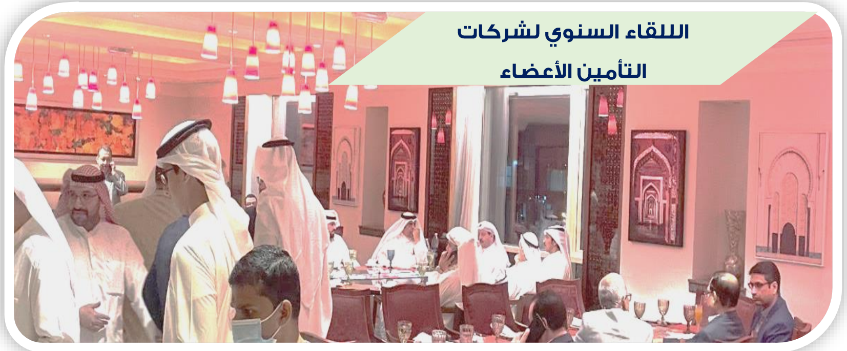
اللقاء السنوي لشركات التأمين الأعضاء

المشاركة في ورشة العمل بغرفة صناعة وتجارة الكويت بتاريخ 2022/11/24 بعنوان ( اهداف التنمية المستدامة ) التي حضر فيها ممثل لمنظمة الأمم المتحدة . والاتحاد يدعو كافة الشركات الأعضاء الى المساهمة في تحقيق التنمية المستدامة وتشجيع المبادرات في رفع الوعي المجتمعي بأهمية هذا الموضوع لحاضرنا ومستقبلنا.