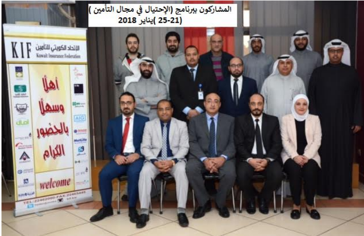
برنامج الاحتيال في مجال التأمين 25-21 يناير 2018