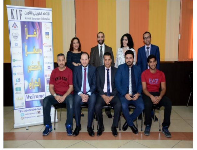
برنامج ادارة النقدية والسيولة 19-16 ابريل 2018