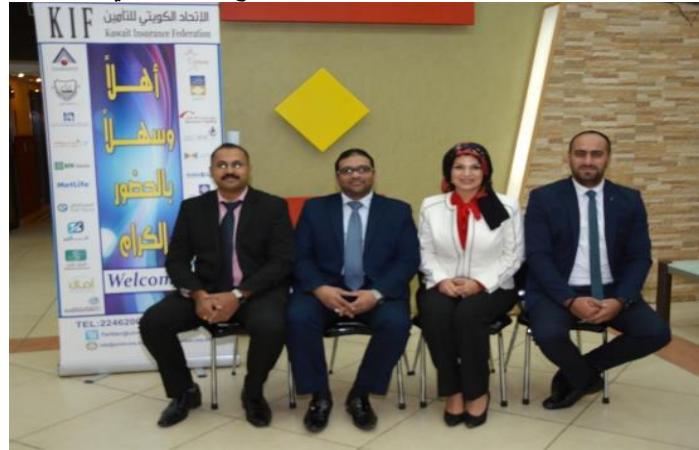
برنامج English Report Writing 10-6 مايو 2018