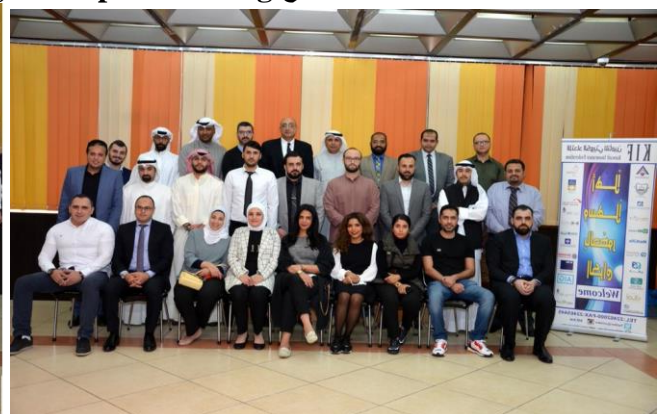
برنامج تسوية المطالبات 13-9 ديسمبر 2018