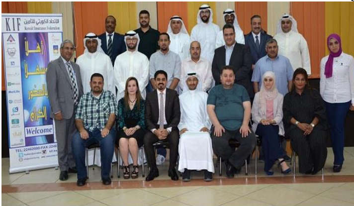
برنامج المخصصات الفنية 11-7 اكتوبر